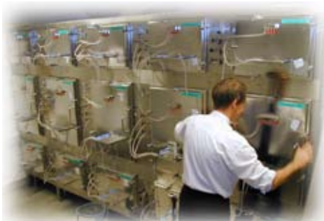
Produktmissionen werden in Prüfkammern aus Glas oder Edelstahl geprüft.

Emissionsprüfungen werden an verschiedenen Produkten vorgenommen, um die Übereinstimmung mit gesetzlichen Anforderungen oder mit freiwilligen Ökolabels zu dokumentieren - beispielsweise für Bauprodukte, Möbel und Ausbaukomponenten für den Innenraum von KFZ. Die Reproduzierbarkeit dieser Prüfungen von Labor zu Labor ist noch nicht zufriedenstellend